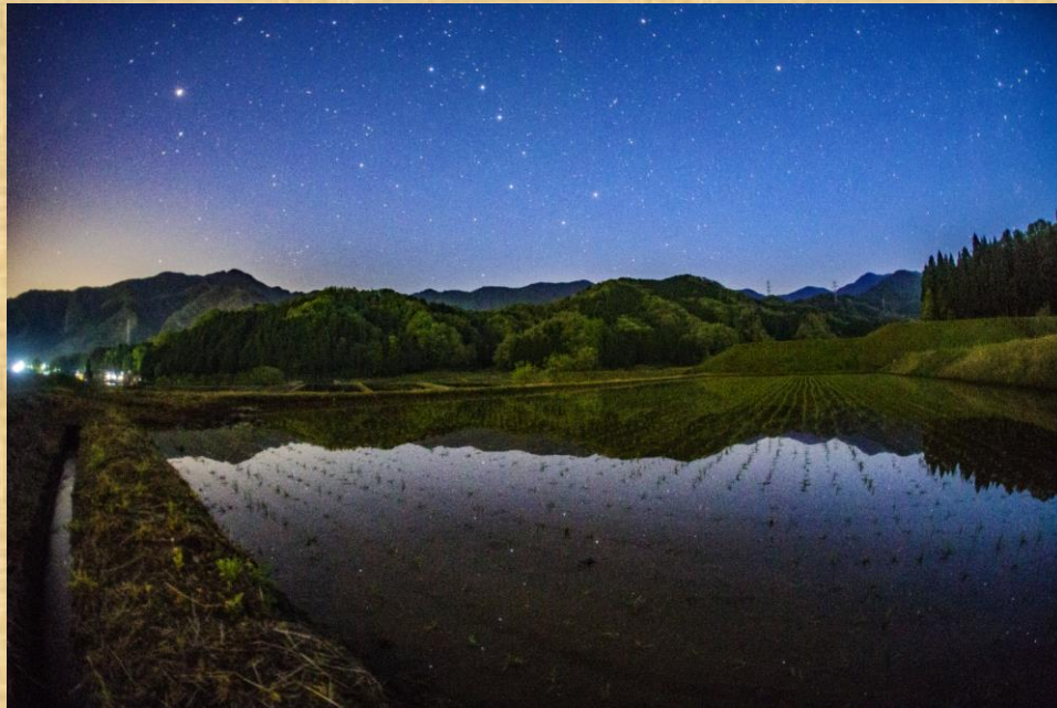
「水田に写る北斗七星」

風のない5月初旬の夜、田植えが終わったばかりの水田の水面に、北斗七星が映り込んでいました。生まれ育った家の周りに水田が多かったからか、水田の風景を見て、なんだかホッとしました。