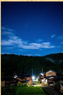
「人と自然が生きる福井の夜空」