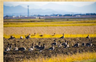
「坂井平野のマガン」