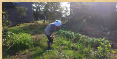
「葱を選ぶ、ばあちゃん」