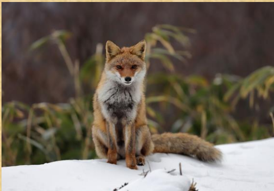
「雪の林道での出会い」

すっかり葉っぱを落としたブナの木々は風で雪が吹きつけられて樹氷のようになっていました。撮影を終えて帰路につくと林道で1匹のキツネに出会いました。近くによってもあまり怖がらず、素敵な被写体になってくれました。